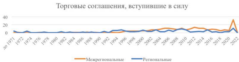
Рис. 1. Количество действующих торговых соглашений и распределение по году вступления в силу в период с 1971 по 2022 г.