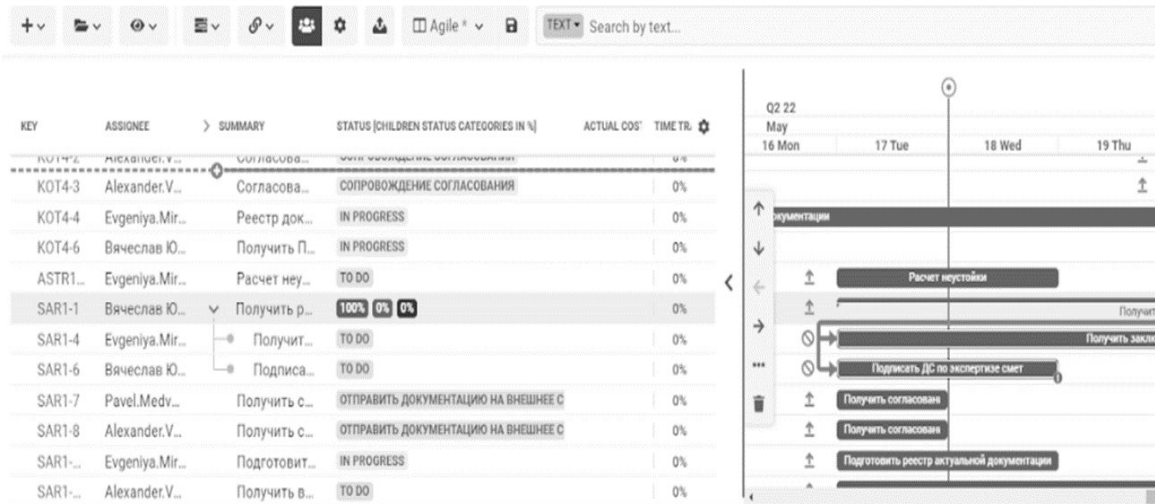
Рисунок 3. Диаграмма Гантта