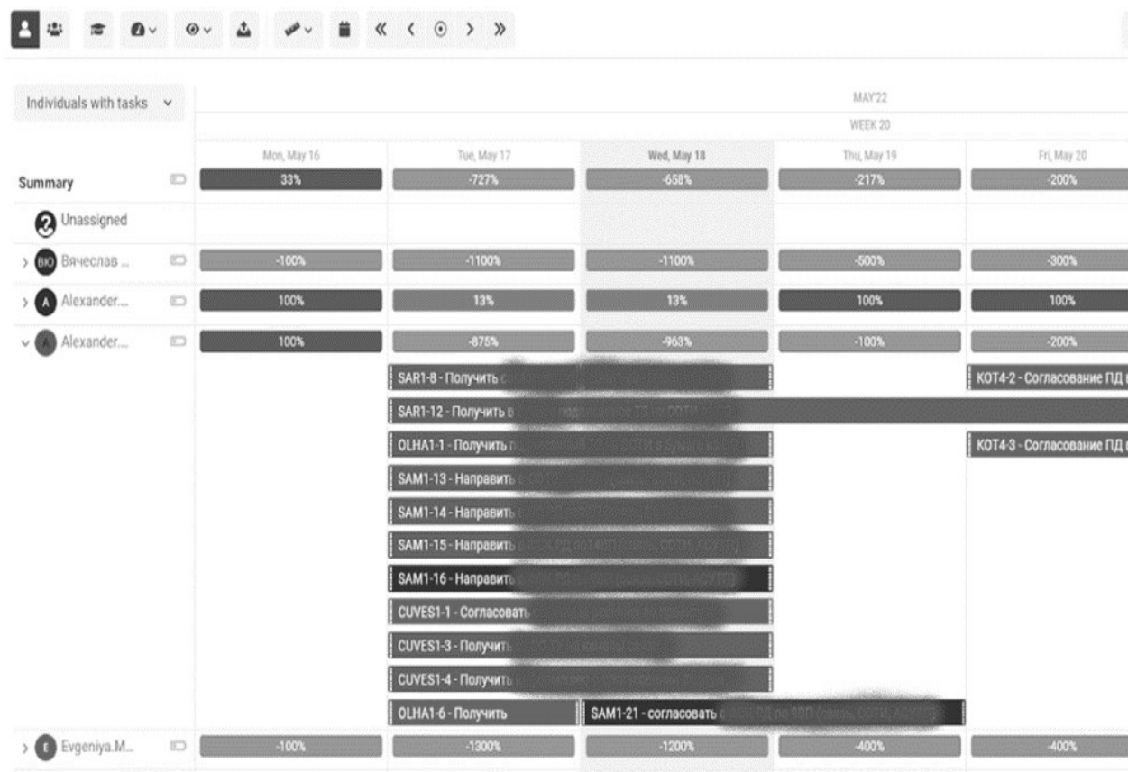
Рисунок 5. Ресурсная диаграмма 8

Пример ресурсной диаграммы проекта, представлен на рисунке 5.