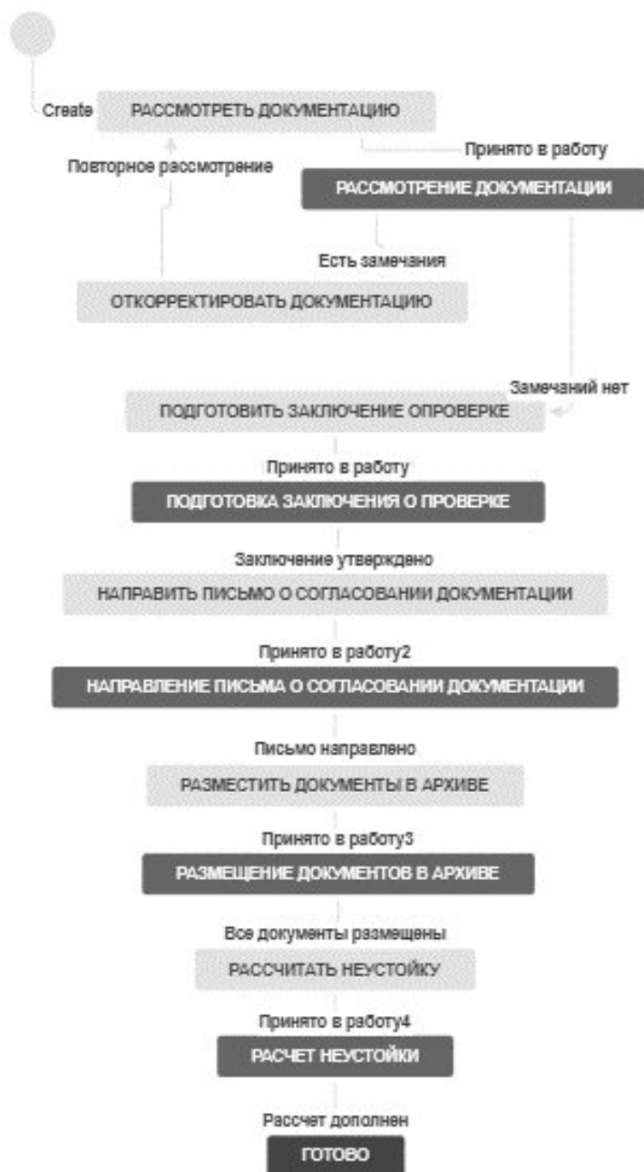
Рисунок 4. Пример индивидуальной схемы бизнес-процесса.

Программное обеспечение «Jira» имеет ряд аналогов, которые в той или иной степени позволяют также осуществлять эффективное управление проектом. В таблице 1 приведен сравнительный анализ наиболее известных аналогов программного обеспечения «Jira».