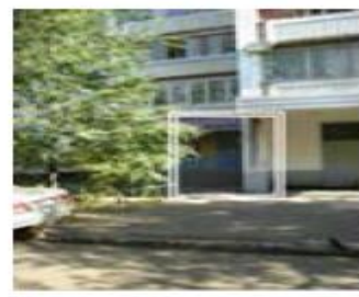
Рис. 4. Месторасположение парикмахерской

Собственнику желательно создать поток посетителей хотя бы 150 человек в неделю. Ассигнования, выделенные собственником на продвижение парикмахерской – не более 100 000 рублей. На той же улице четыре месяца назад открылась парикмахерская-конкурент на 4 посадочных места. Никаких услуг, кроме стрижки, не оказывают. Помещение крохотное, люди ждут своей очереди прямо в салоне. Работают 18-летние гастарбайтеры из Молдовы и Украины.