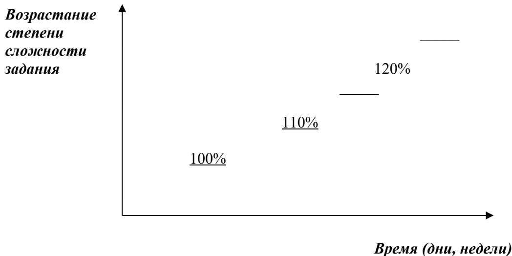
Рис.1. Формирование мотивации достижения рабочего.

55. Определите принадлежность данной теории к определенной школе. Дайте краткое резюме по данной теме.