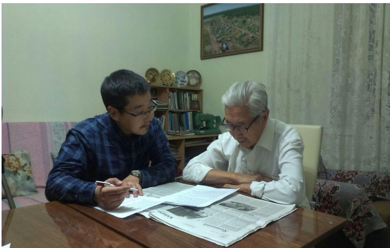
Рис.15. Моменты подготовки к видеосъемке. Ноябрь 2015 г.