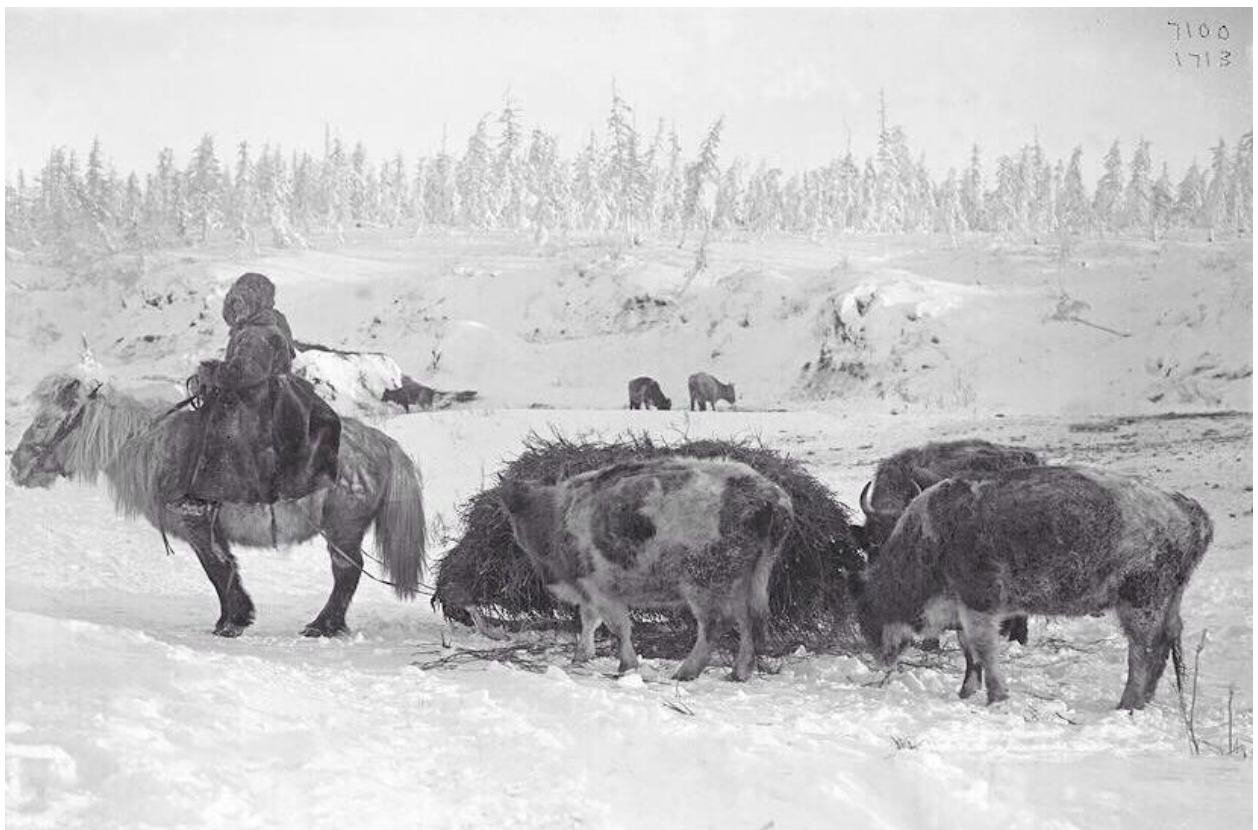
Рис.9. Перевозка сена