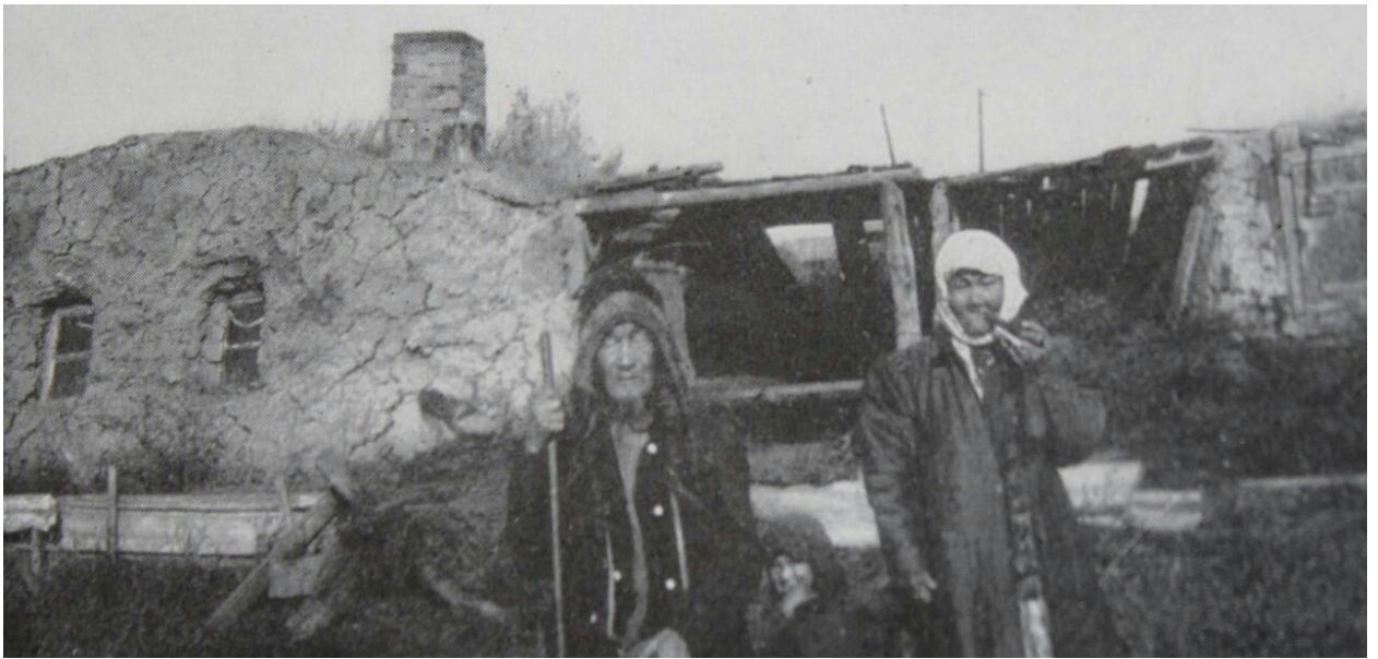
Рис.5. Якутская юрта-балаган с пристройками