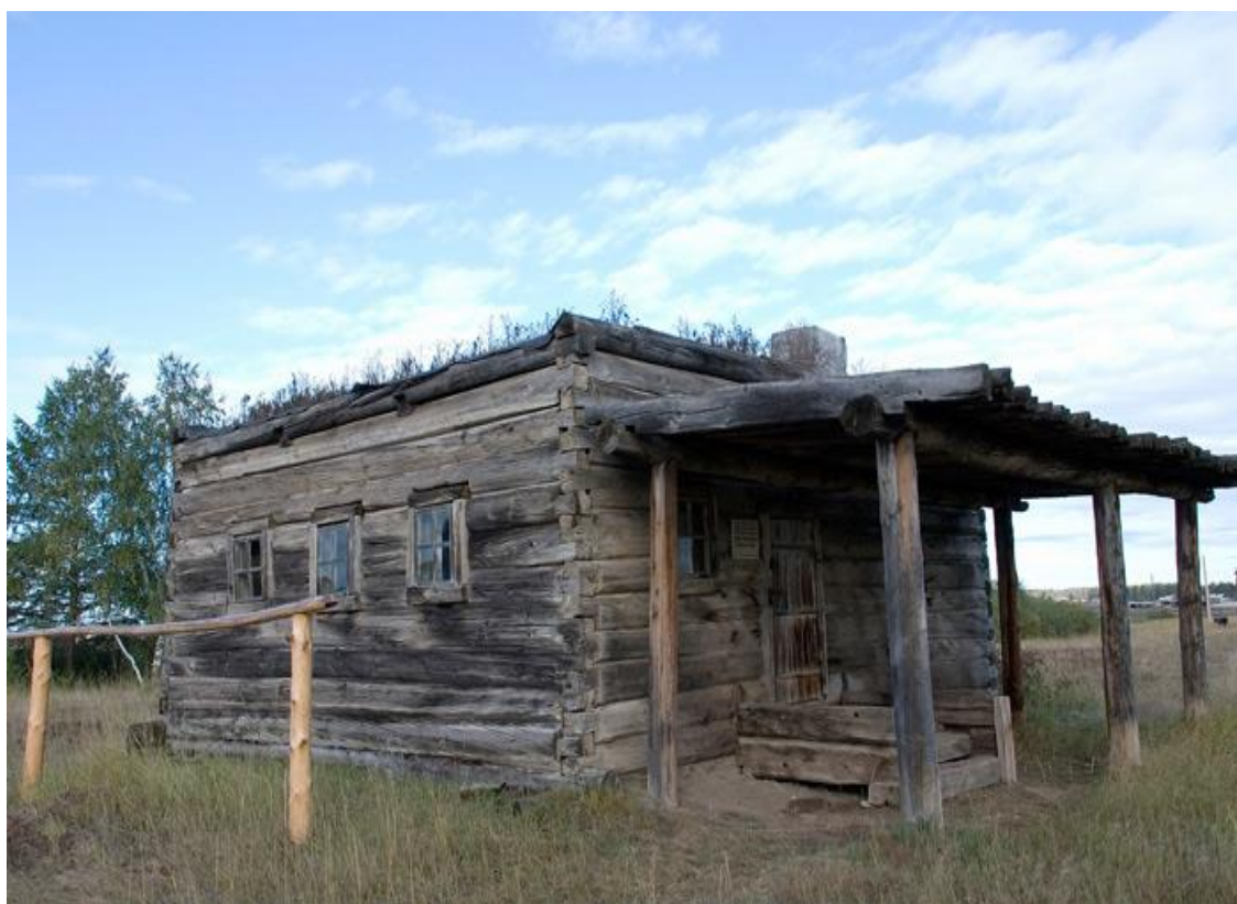
Рис.11. Срубный дом «Ампаар дзыэ»