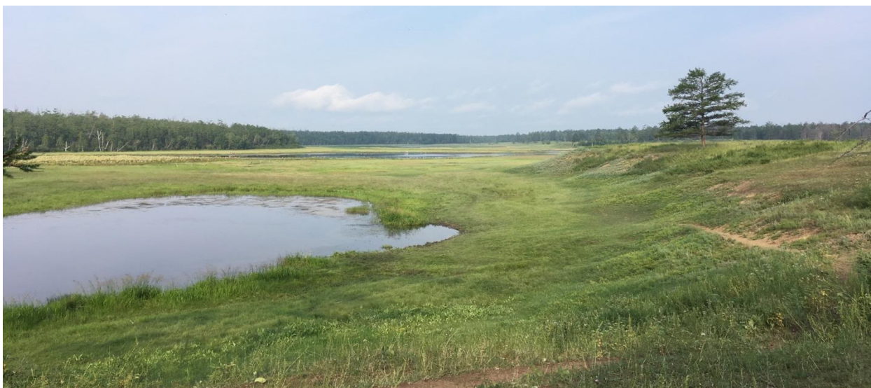
Рис.1. Алаас – долина термокарстового происхождения