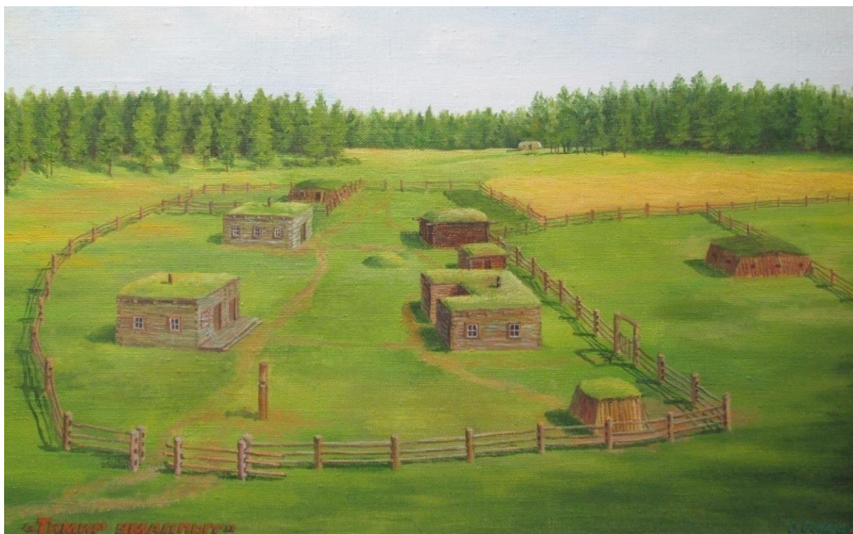
Рис.2. Традиционная якутская летняя усадьба.