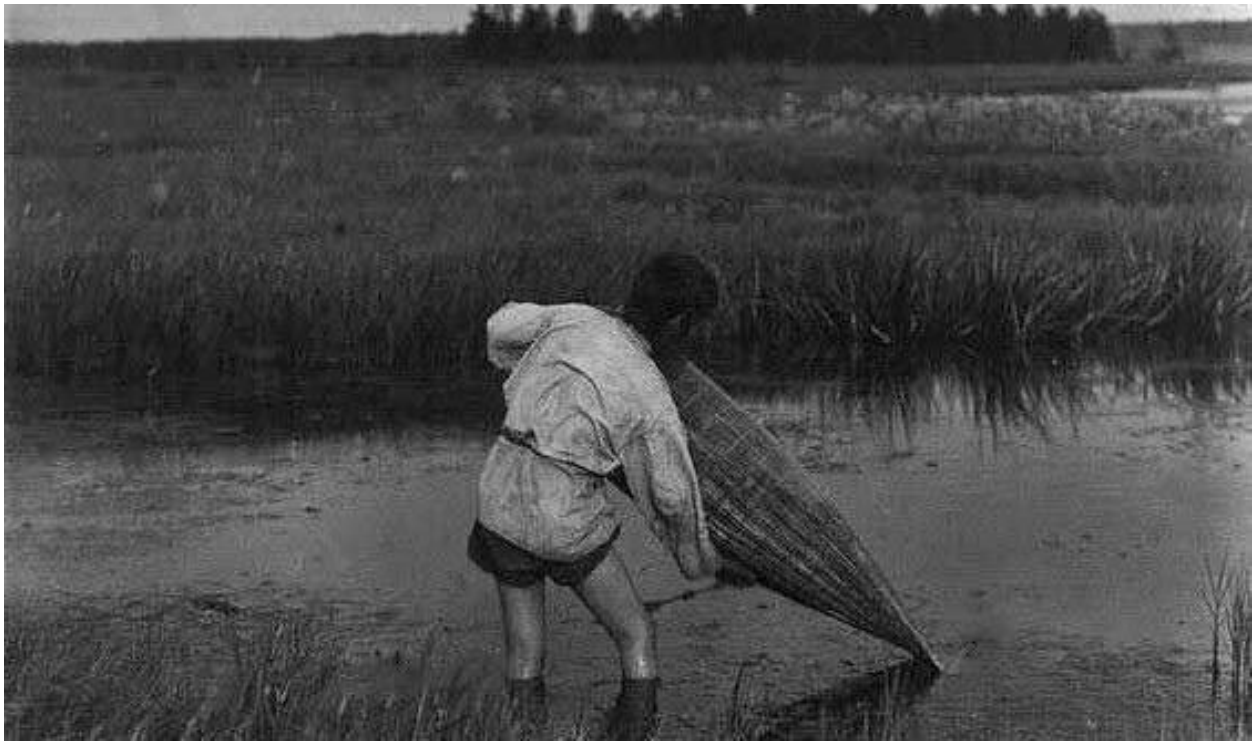
Рис.12. Установка верши «туу» на озерную рыбу