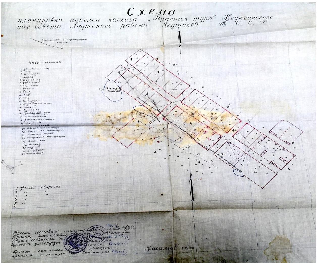
Рис.13. Схема планировки поселка колхоза «Красная Тура»