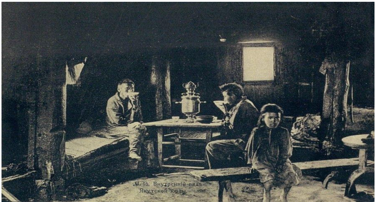
Рис.8. Внутренний вид якутской юрты