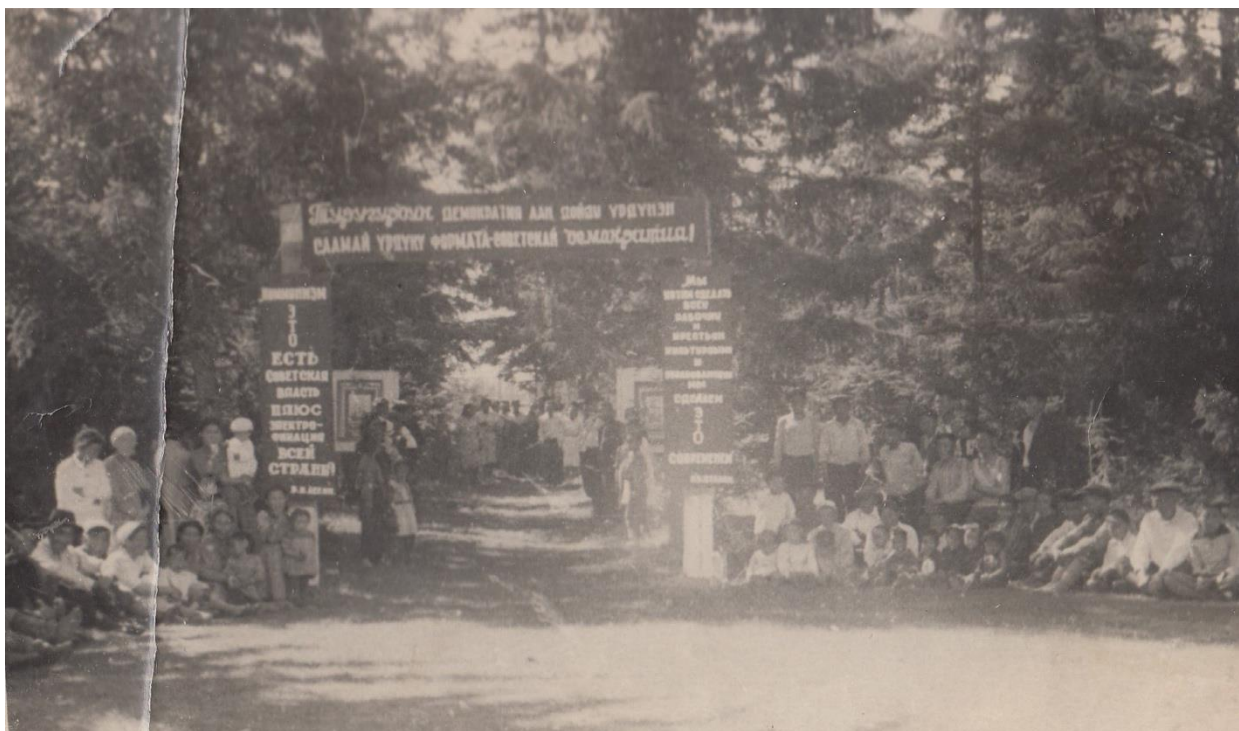
Рис.14. Ысыах в Качикатском наслеге Орджоникидзевского района