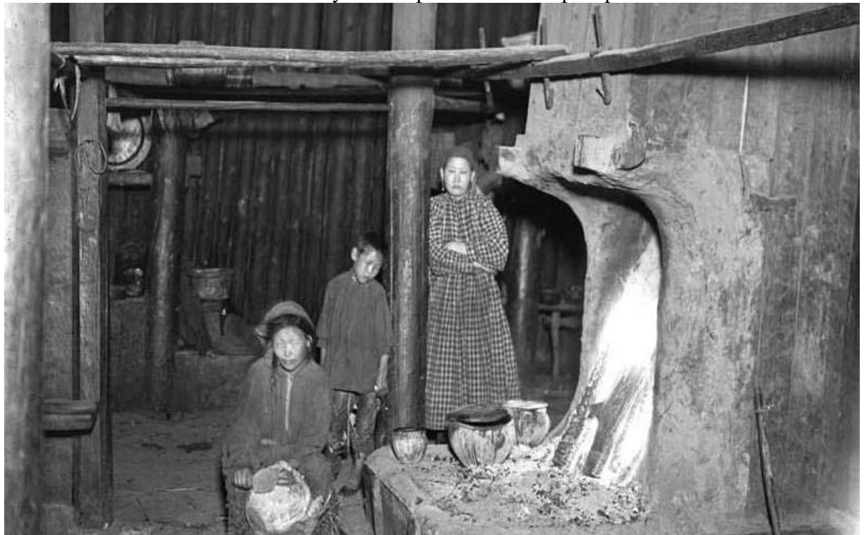
Рис. 6. Печь-камелек