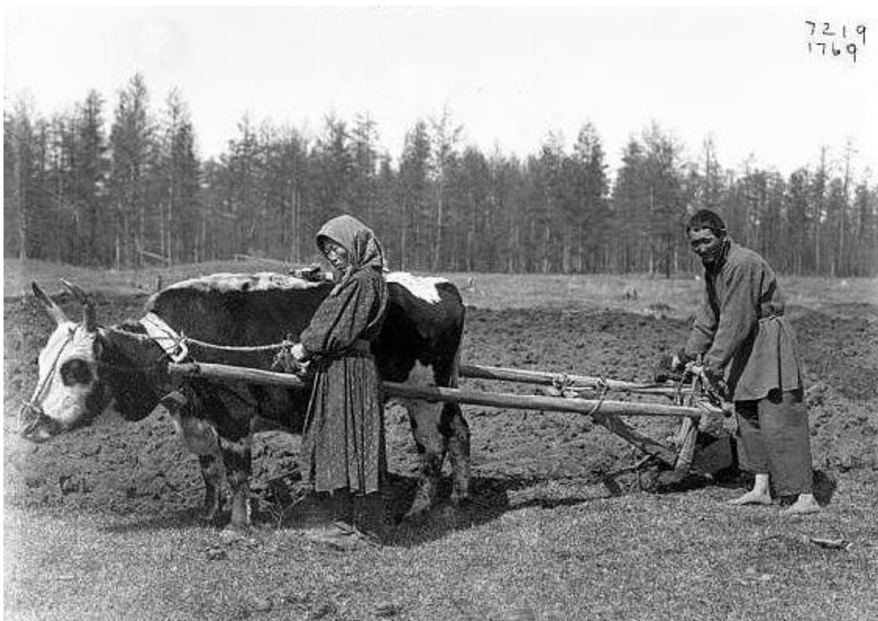
Рис.10. Вспашка пашни