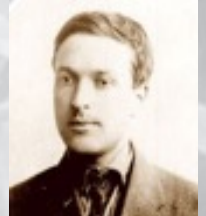
Л.С. Выготский (1896-1934)

"Todas as funções psicológicas superiores têm sua história, através da qual podem ser estudadas."