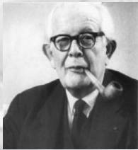
J. Piaget (1896-1980)