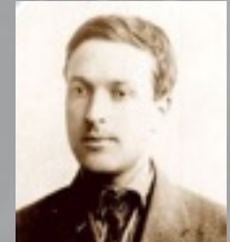
L. Vygotsky (1896-1934)

"O pensamento não se expressa, mas se realiza na palavra"