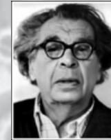
D. Elkonin (1904-1984)

Psicologia Não-Clássica (Estudo da transformação cultural da consciência e da psique)