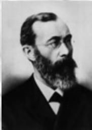
W. Vundt (1832-1920)

Psicologia Clássica (Estudo da experiência subjéctiva)