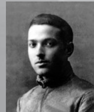
L. Vygotsky (1896-1934)

Psicologia Clássica (Estudo da experiência subjéctiva)